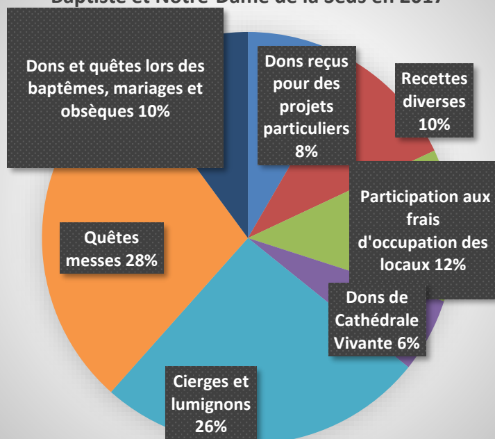
Répartition des recettes Cathédrale, St Jean-Baptiste et Notre-Dame de la Seds en 2017