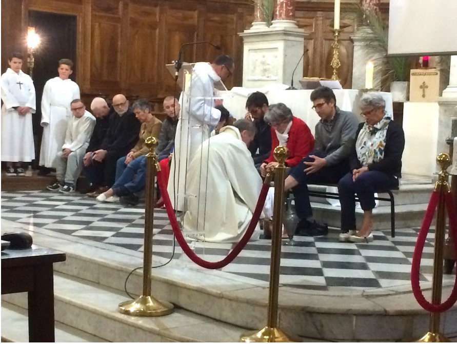
Le lavement des pieds