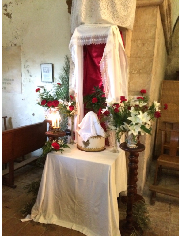
Reposoir à la chapelle Saint Cyr