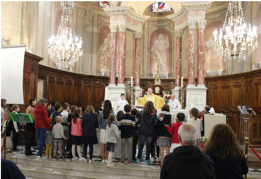
Les nouveaux baptisés