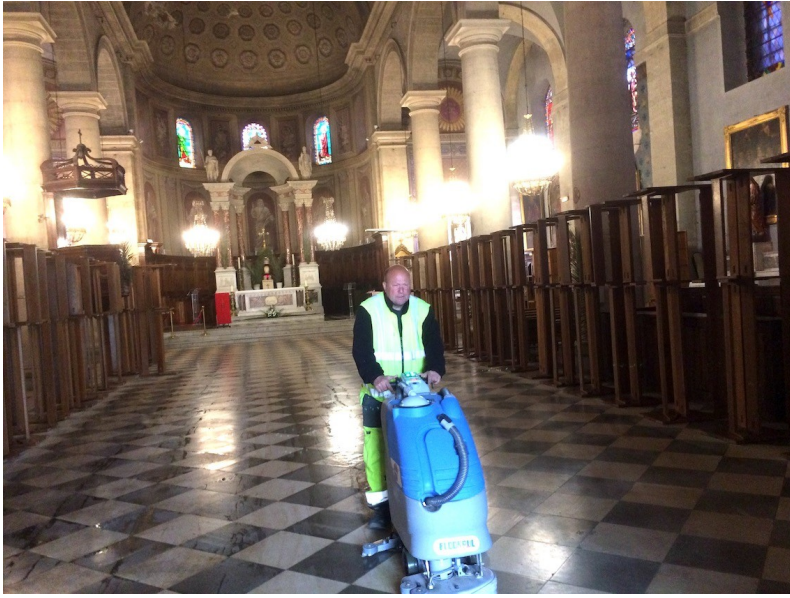
Grand nettoyage !