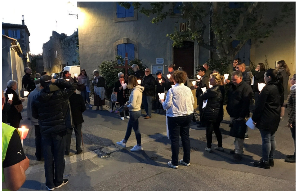
Chemin de Croix à Lançon