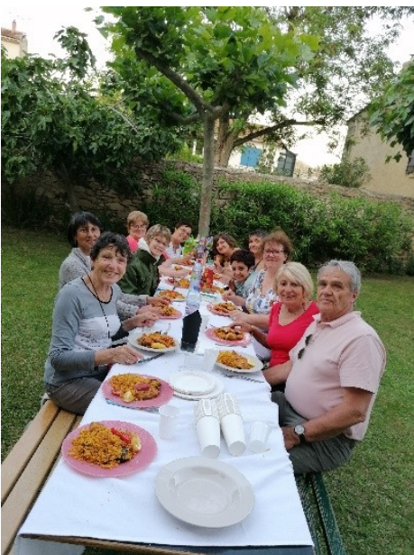
Une partie de l'équipe des coordinateurs et des prêtres des quatre Unités Pastorales engagées dans le Parcours Alpha.