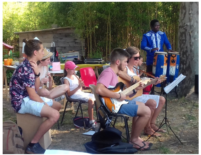
Merci aux jeunes qui ont animé la messe!