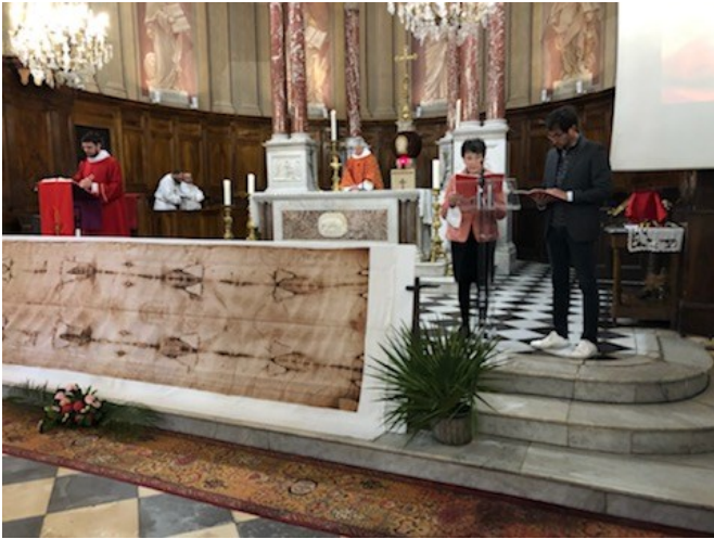
Conférence sur le Saint Suaire, samedi 27 mars, avant la fête des Rameaux: