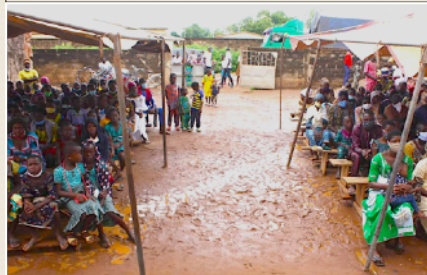
La saison humide de mars à octobre