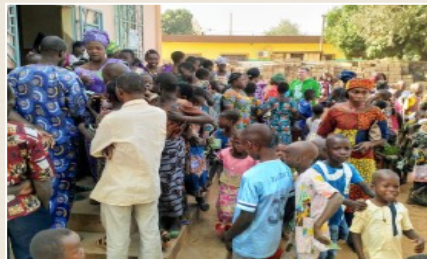
Une communauté jeune et active