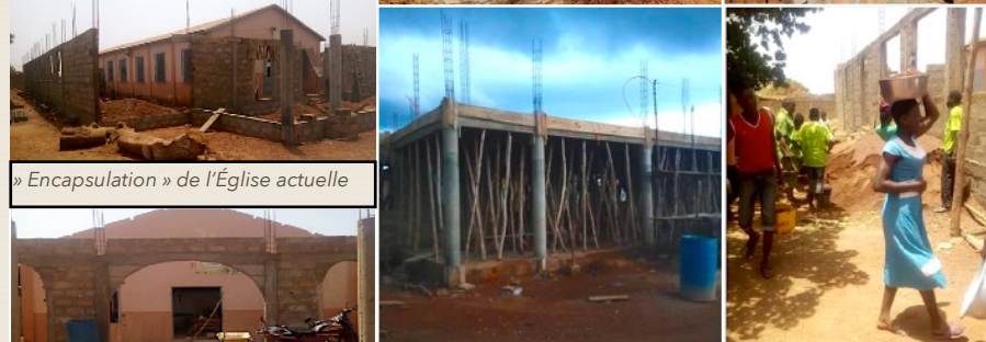
» Encapsulation » de l'Église actuelle