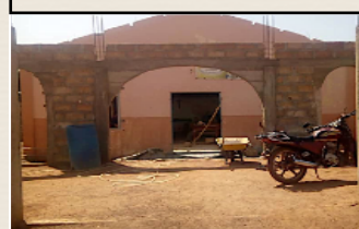
Les murs sont bâtis et attendent leur nouveau toit !