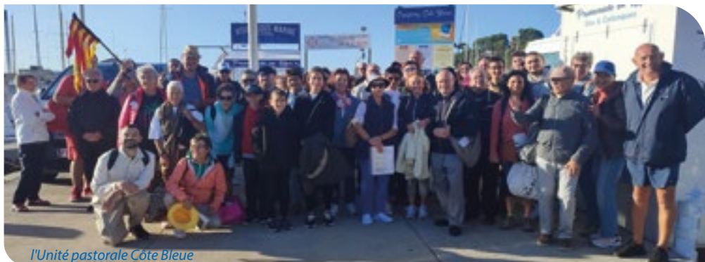
l'Unité pastorale Côte Bleue

Nous voici 56 000 fidèles et 700 prêtres et diacres, tous réunis autour du successeur de l'apôtre Pierre, le pape François, sous le regard de Notre Dame de la Garde. Le temps de cette messe votive à la Vierge Marie, nous devenons ce que