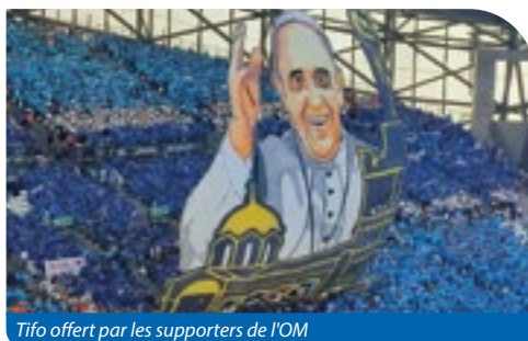
Tifo offert par les supporters de l'OM

Les mots manquent pour décrire la ferveur, le recueillement, cette communion vécue ensemble.